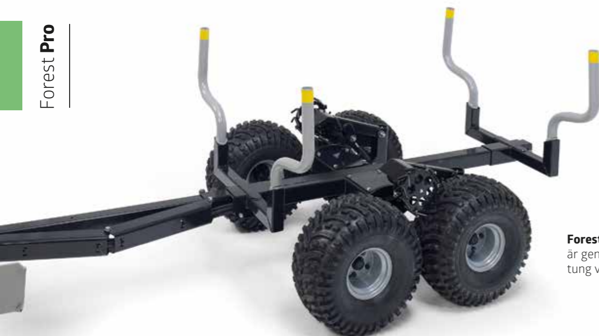
Forest Pros ramkonstruktion är genial och byggd för att bära tung vikt.