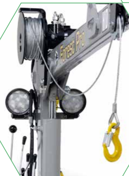
Forest Pro-hydraulvinsch och arbetsbelysning