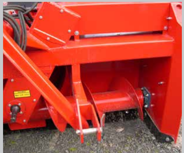
Järeä voimansiirto ketjulla ja kulmavaihteella.