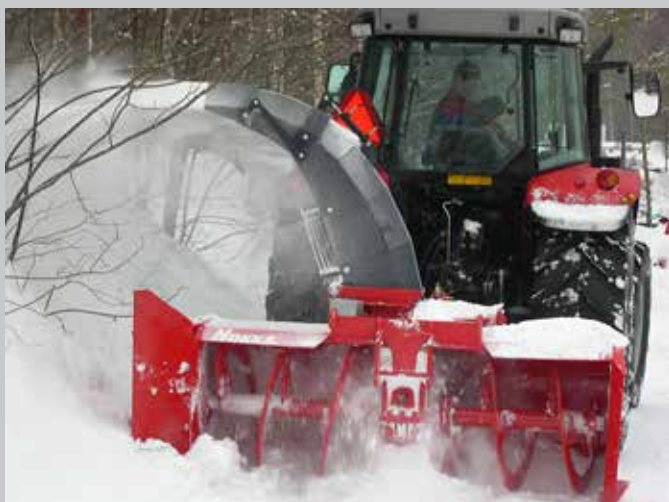
LR4271 asennettuna työntöasentoon.