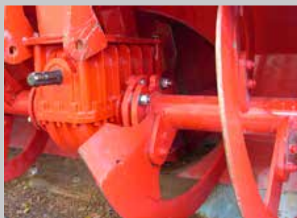
Järeä kulmavaijde- ja avara syöttökierukkarakenne.