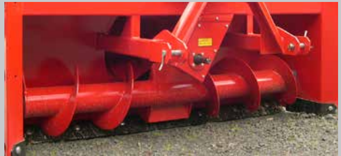
LR 4251:n poikittain oleva ruuvisyöttö on tehokas lumensiihtäjä heittosiivikolla.