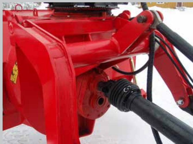
Pikakiinnitteinen vetolaite etunostolaitesovitteisena varustettuna suunnanvaihtajalla (lisävaruste).