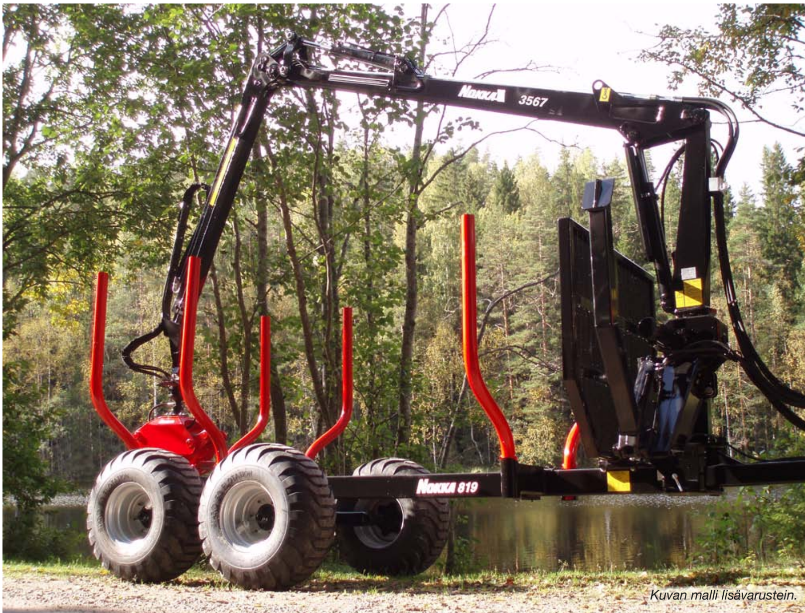
Kuvan malli lisävarustein.