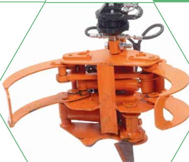
Forest Pro -energiakoura