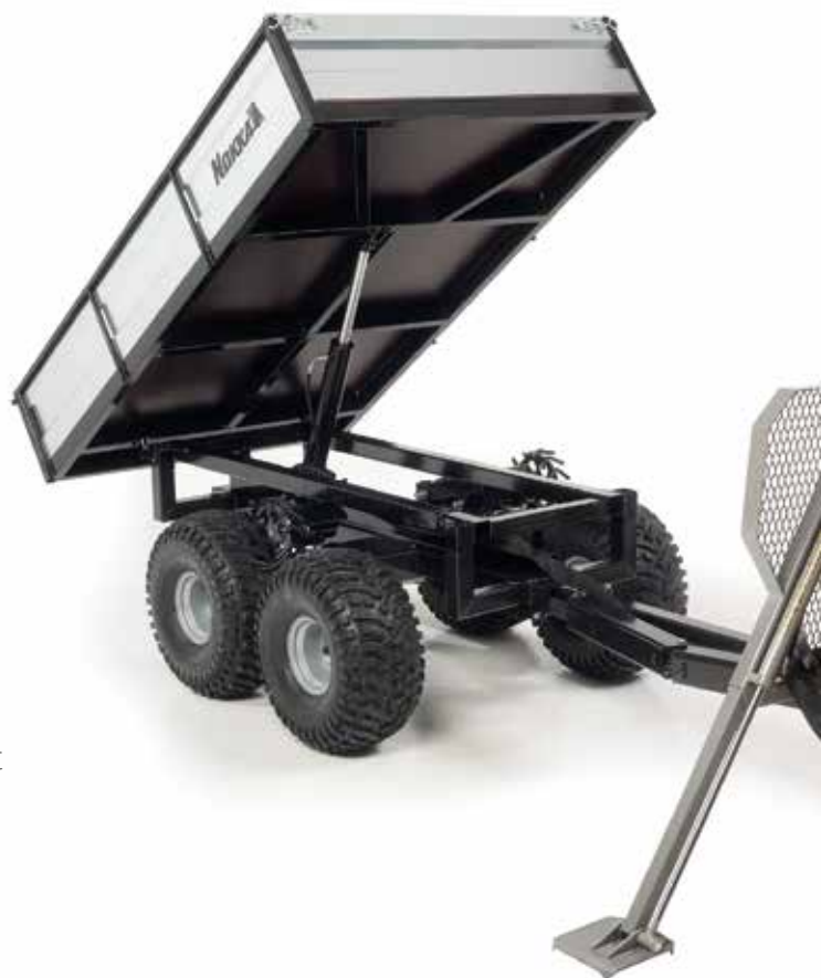
Forest Pro -kippilava

Nokka Forest Pro edustaa laadukasta suomalaista teknologiaa ja työkonesarjaa. Se on asennettavissa kaikkiin mönkijöihin tai vetokoneisiin, joissa on vetokoukku. Sopii myös pientraktoreihin.