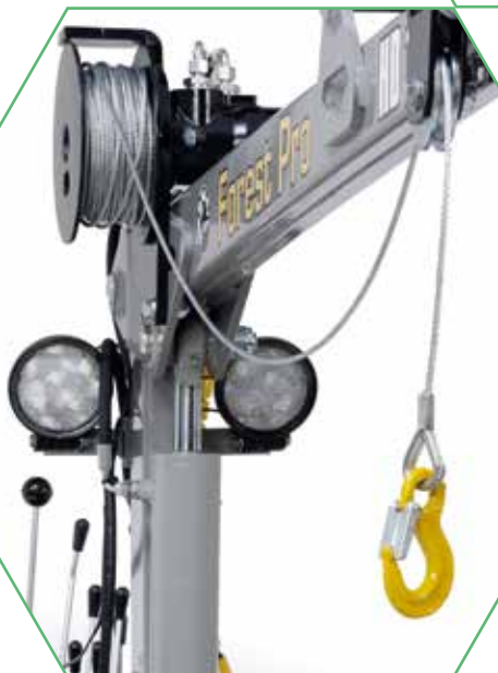
Forest Pro -hydraulinssi ja työvalo