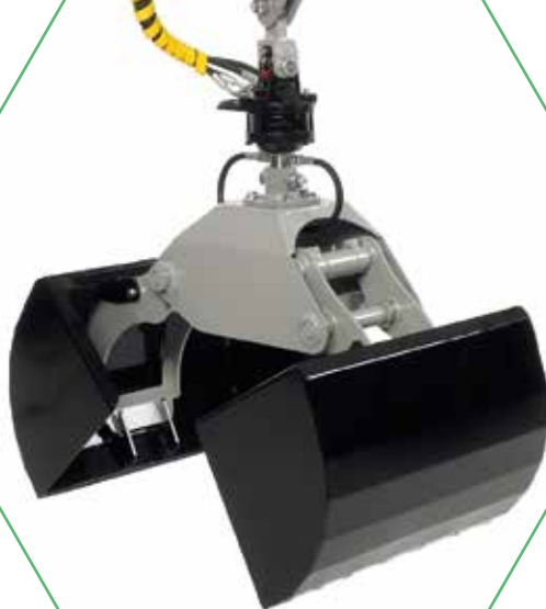
Forest Pro -kahmarikoura